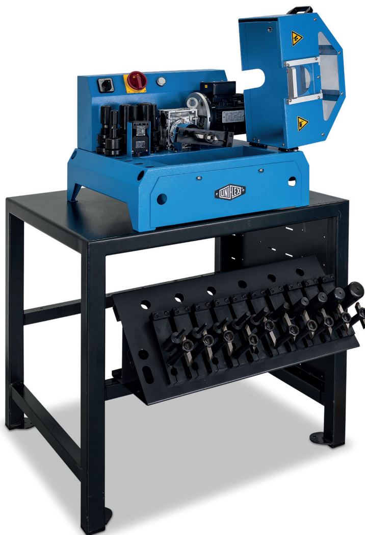
USM 10 S Mit TU-Tisch und Werkzeugablage (USM 10 S TU Paket).

Mit der USM 2 und USM 10 treffen Sie die optimale Schlauch-Vorbereitung für die Armaturenmontage. Die Maschinen zeichnet sich aus durch eine anwenderfreundliche Bedienung, die bequeme Fußtaster-Steuerung beim Schälprozess und die schnelle Umrüstung der Werkzeuge. Die USM 2 und 10 schälen innen von 5/8 Zoll bis 2 Zoll und außen von 3/16 Zoll bis 2 Zoll. Dies rundet das Bild einer perfekten Systemlösung ab.